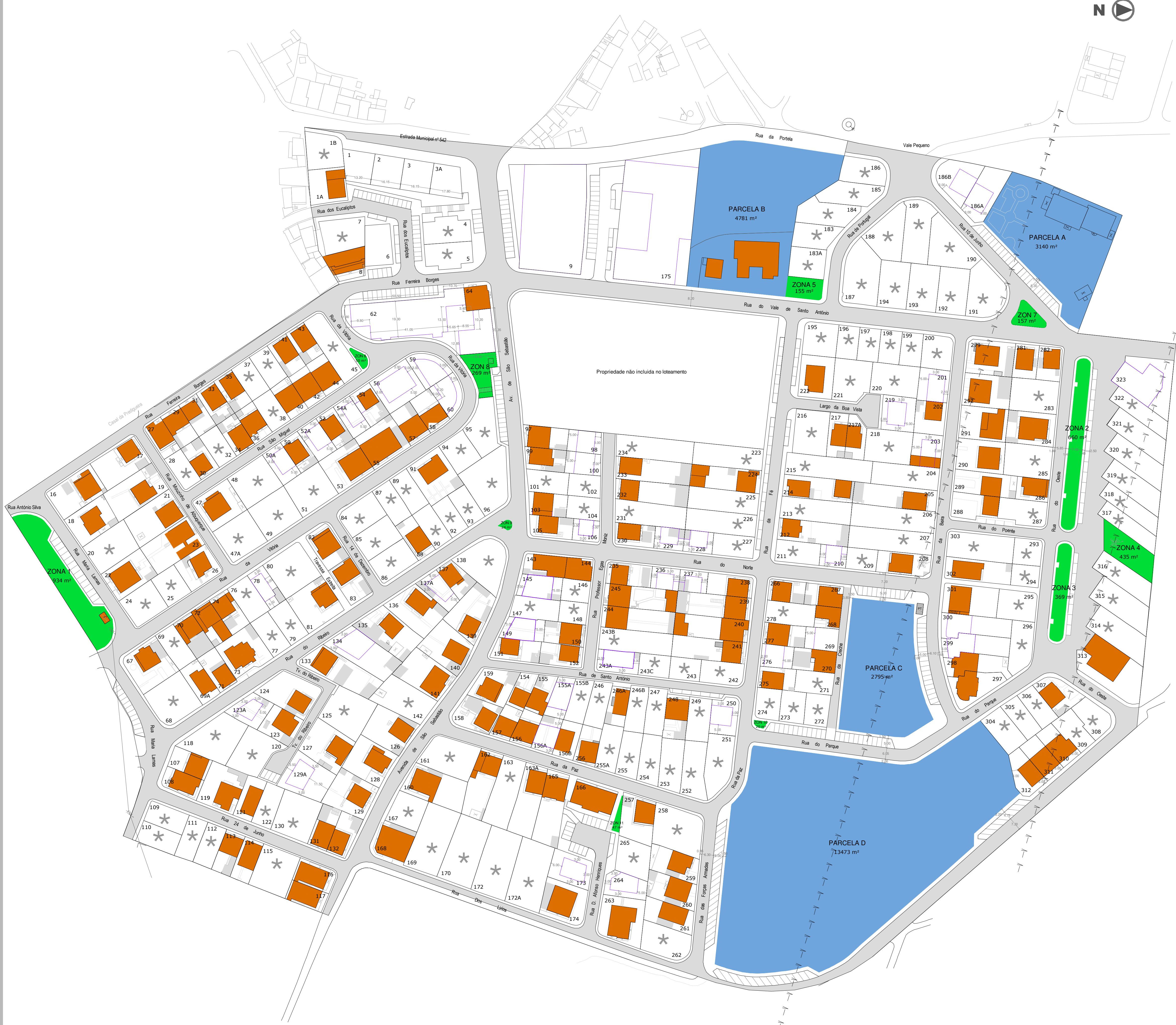
QUADRO DE LOTES