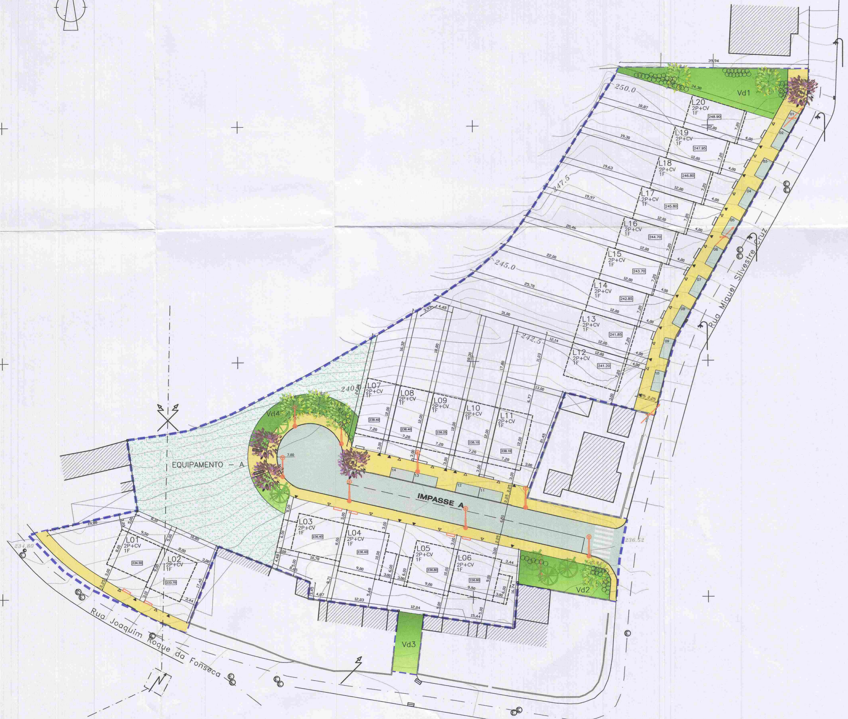
Quadro de Lotes