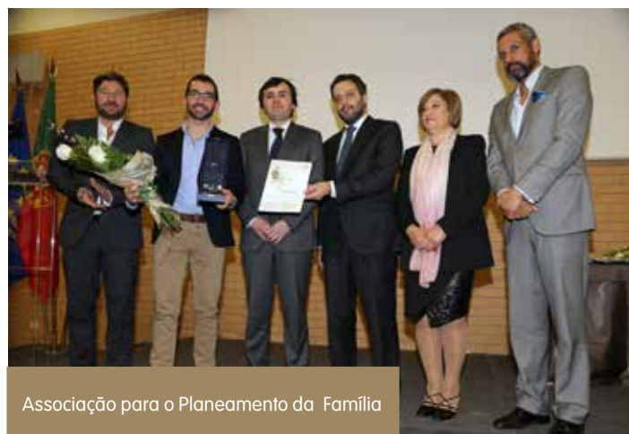
Associação para o Planeamento da Família