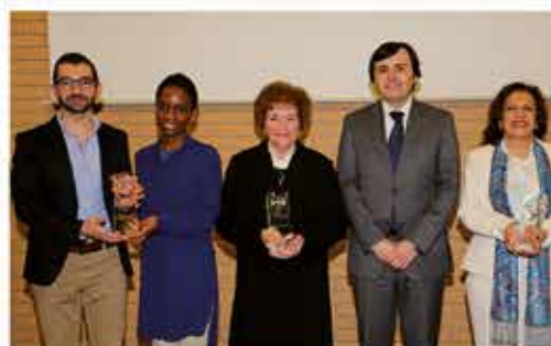
DIA INTERNACIONAL DA MULHER Prémio Municipal Beatriz Angelo pág. 5