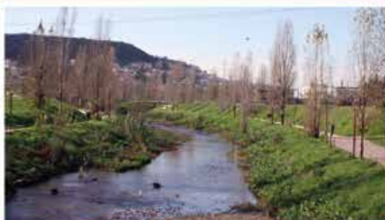
LINHAS DE ÁGUA Concelho mais limpo e mais verde pág. 7